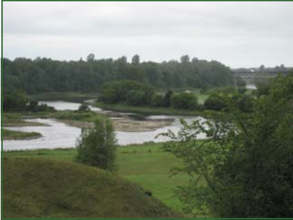
Rivière Nicolet, St-Léonard d'Aston